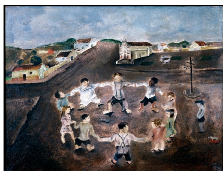
RODA INFANTIL, 1932 – CÂNDIDO PORTINARI.

Você sabia que muitos artistas fizeram composições maravilhosas com esse tema cantigas de roda? Veja a obra de Cândido Portinari e, de Ivan Cruz, a seguir: